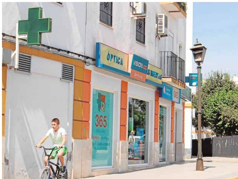
A pie de calle, los termómetros marcaban ayer 42 grados a las 12 horas A.L.