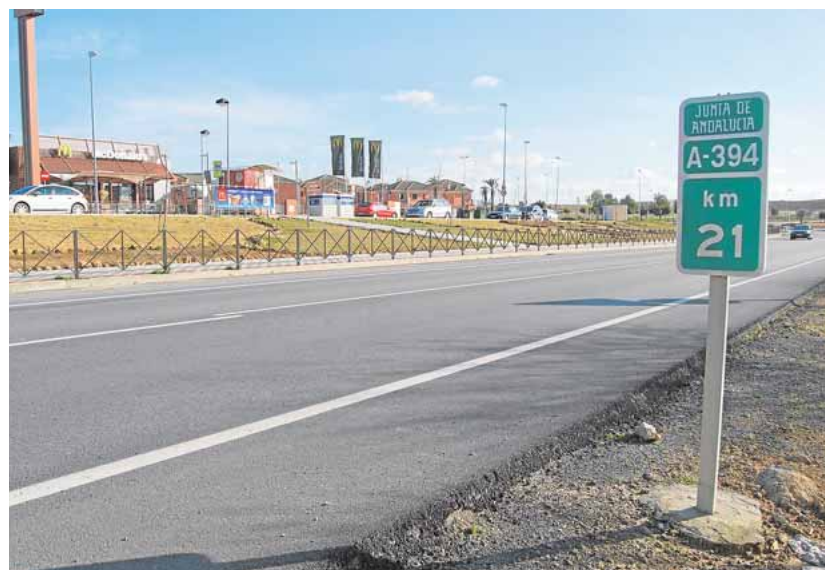
Una de las carreteras utreranas que cuenta con radar móvil este verano

Además de estos radares móviles los conductores también deben estar pendientes de los radares fijos, que en este caso se encuentra en la autovía Sevilla-Utrera (A-376). Una vía que cuenta con un radar para cada sentido a la altura de Montequinto.