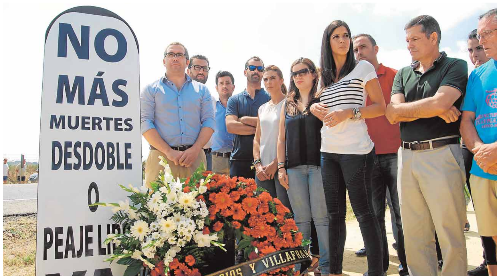
Representantes del Ayuntamiento de Los Palacios, reclaman una solución a la alta siniestralidad de la carretera en una de sus concentraciones

ximo sábado en las instalaciones de el Palmar de Troya. El motorista alevín ya debutó el pasado 28 de junio en una carrera de este campeonato, en concreto en la categoría alevín-juvenil de 85 c.c., quedando clasificado en quinto lugar. F.R.M.