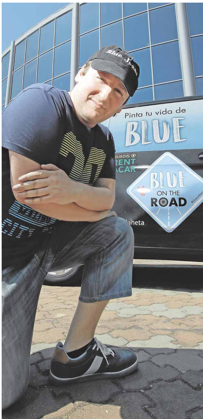
El autor realiza este mes una gira por toda España

número de personas que han pasado por la Oficina Municipal de Turismo ha sido durante los últimos seis meses de 33.448. Destaca además el aumento en un 32 por ciento de la venta de entradas al Alcázar y de productos turísticos. A.M.