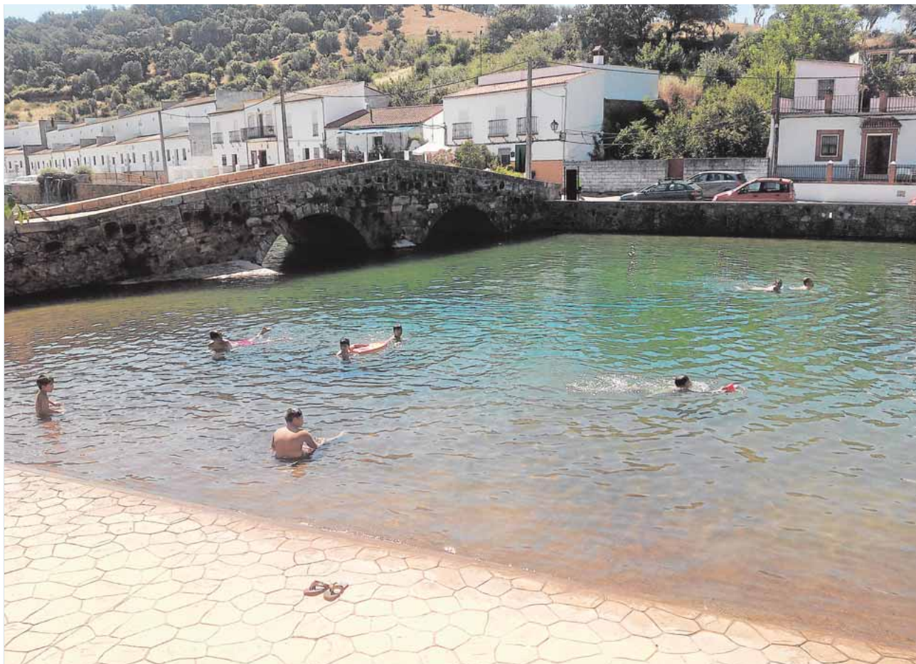
Los bañistas disfrutando de un chapuzón en la playa fluvial de San Nicolás del Puerto

ria y Fiestas de Constantina 2015. El plazo de presentación finaliza el 30 de julio. El tema y la composición de la obra son libres aunque los motivos y los símbolos de la Feria y Fiestas de Constantina deben ser los protagonistas. A.C.