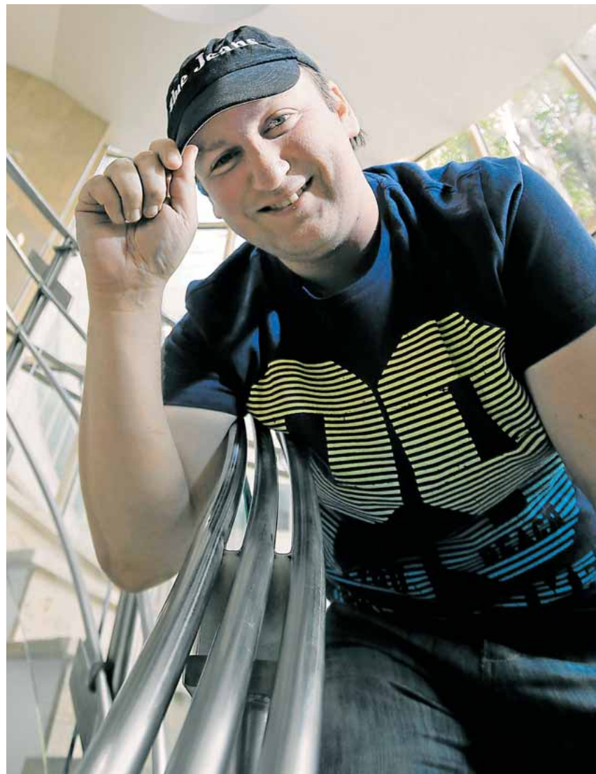
El escritor carmonense acaba de publicar su octava novela