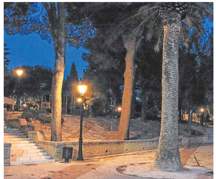
El parque recupera su iluminación tras dos años apagado ABC

Hoy comienza en la localidad el festival de rock y heavy «Acordes de rock», un evento que muestra su consolidación al celebrar su décima edición con un cartel de 34 grupos de toda España. Los amantes de ambos estilos de música de diferentes pueblos del centro de Andalucía son unos habituales de este evento, que alarga sus conciertos desde las cuatro de la tarde hasta las cinco de la madrugada durante tres días. En esta nueva edición el festival se celebra en beneficio de la Asociación Española Contra el Cáncer. Las actuaciones tendrán lugar en el escenario instalado en la explanada de la piscina municipal. B.M.