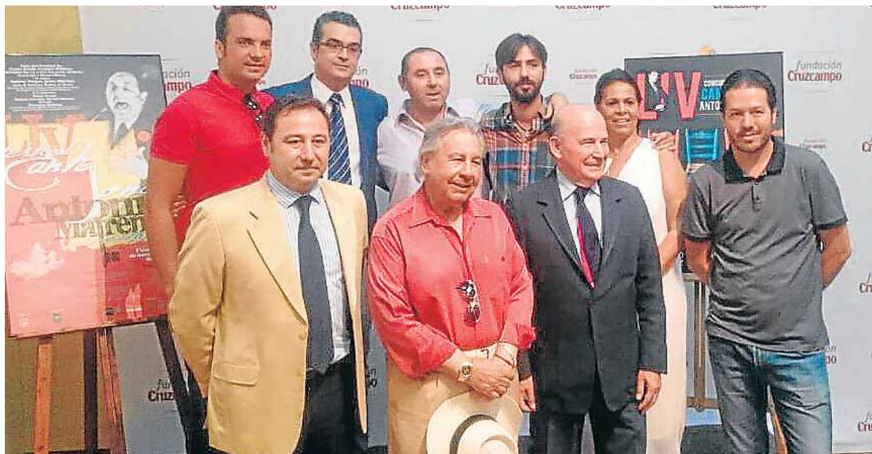
Durante la presentación se dieron a conocer todos los detalles de la LIV edición del Festival

Y aquí va otra de las claves de su éxito: el respeto a los lectores, tratarlos como a personas inteligentes, algo que no todo el mundo hace con los jóvenes. El resultado, según el mismo es que «los lectores se sienten identificados con la historia, se ven dentro del propio libro», comenta a ABC Provincia.