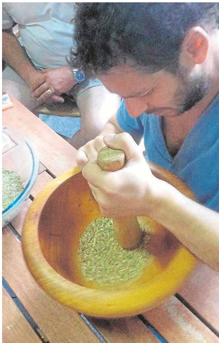
Elaboración del garum, un alimento hecho con hierbas y pescado B.M.

En ningún festín romano podía faltar el vino, pero para completar una experiencia total las investigaciones