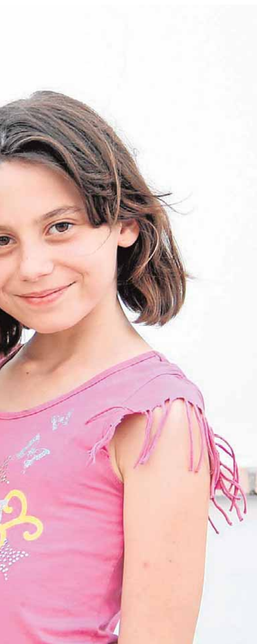
parte las vacaciones

este servicio público tenga conocimiento de las modificaciones realizadas respecto al horario de invierno. El horario de verano comenzará a aplicarse el próximo 12 de julio y tendrá vigencia hasta el próximo 6 de septiembre de 2015.