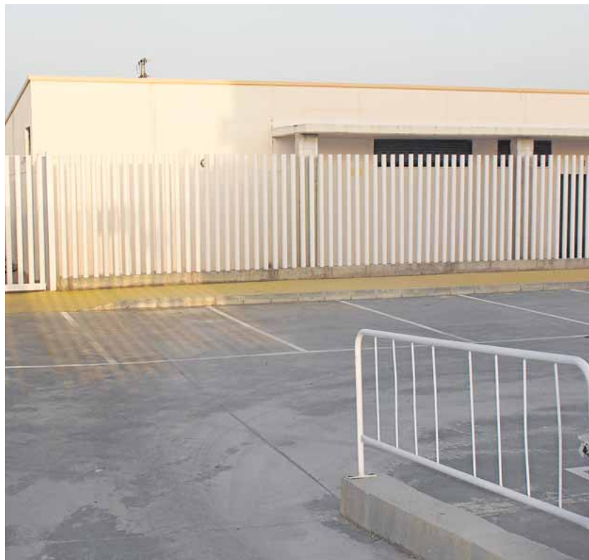
La piscina de Benacazón se encuentra cerrada en plena ola de calor