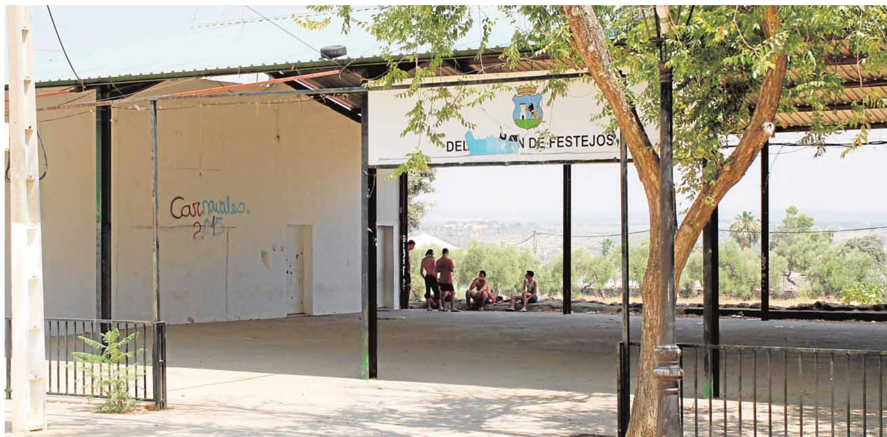
La última feria que acogió el recinto ferial tuvo lugar hace 4 años

La Feria de la Virgen de Gracia no es la única celebración que con el PSOE en la Alcaldía ha quedado en suspenso en los últimos años en Castilblanco, donde desaparecieron de la programación cultural otras citas como el Certamen Provincial de Artesanía y la Feria de Productos Típicos del Corredor de la Plata, que se celebraba coincidiendo con la festividad de Las Candelarias a primeros de febrero en la zona de la Casa de la Sierra.